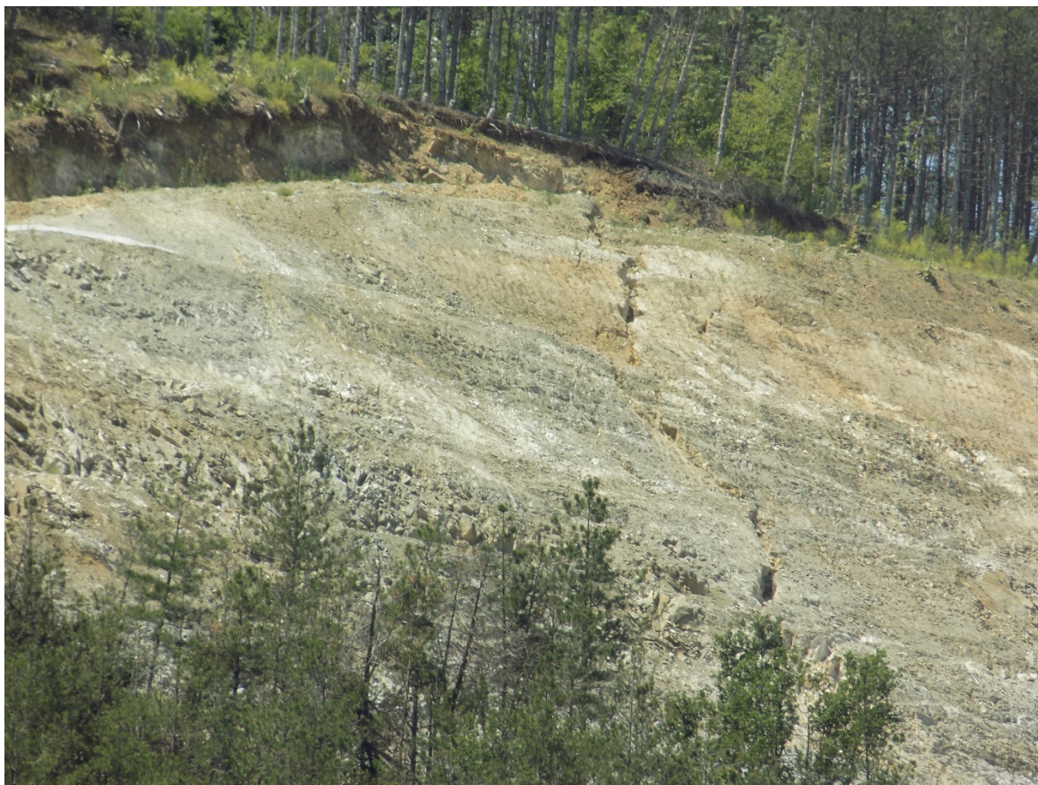
Снимка № 2. Свлячищни процеси в Подучастък 1