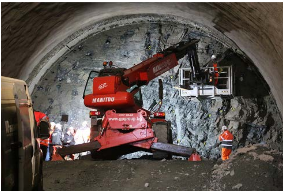
Снимка № 5. Напредък на строителните дейности в подучастък 2 – прокопаване на тунела и първична облицовка