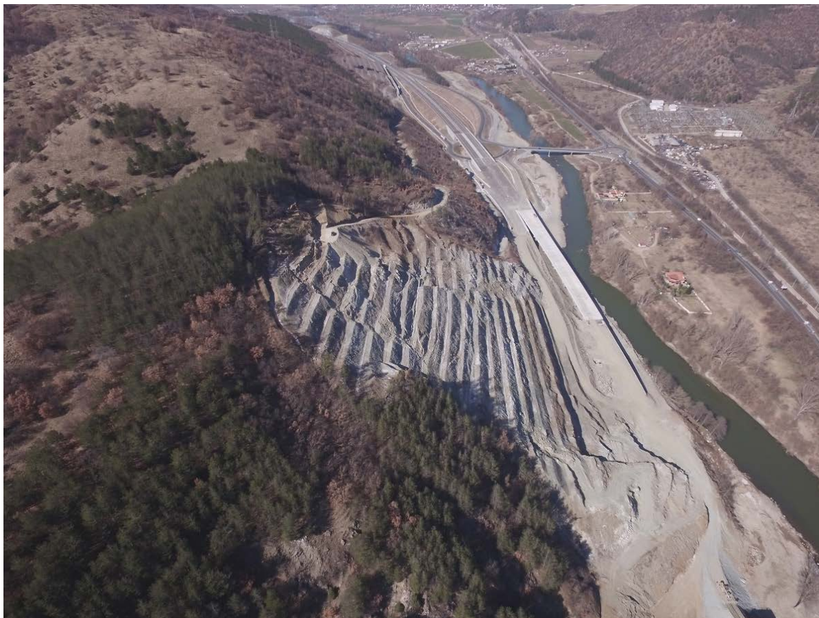
Снимка № 4. Обхват на свлачището в подучастък 1 и в предходния участък от автомагистралата