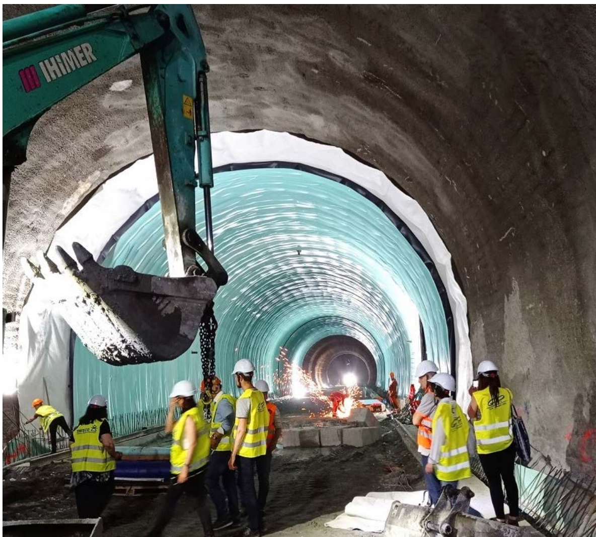
Снимка № 7. Напредък на строителните дейности в подучастък 2 – поставяне на хидроизолация в тунела