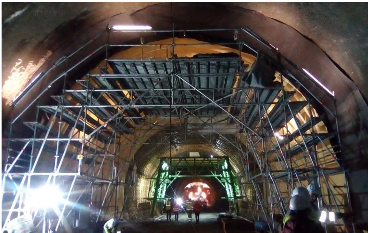
Снимка № 6. Напредък на строителните дейности в подучастък 2 – поставяне на хидроизолация в тунела