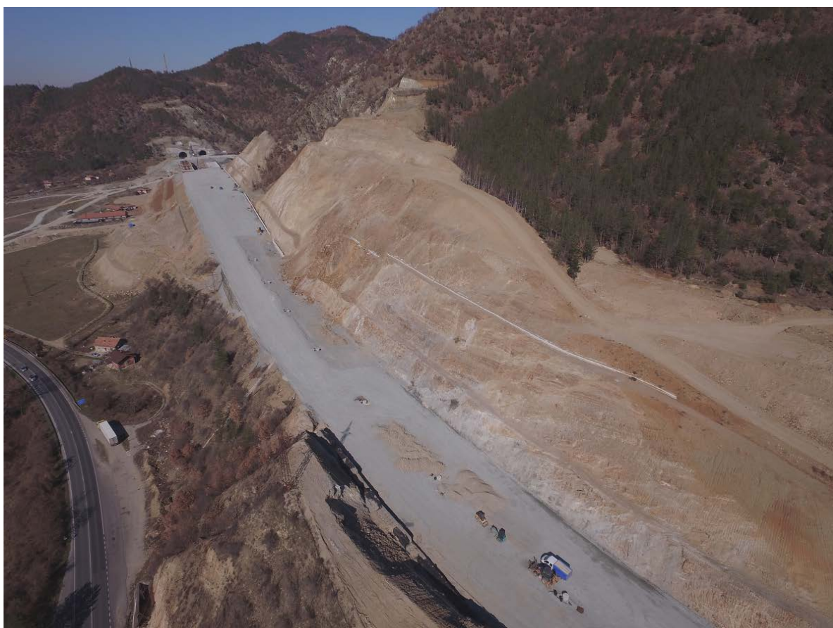
Снимка № 10. Напредък на строителните дейности в подучастък 3