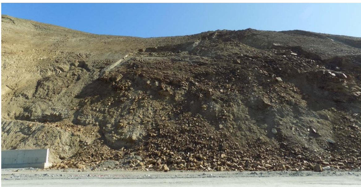
Снимка № 12. Свличане на земни маси в подучастък 3