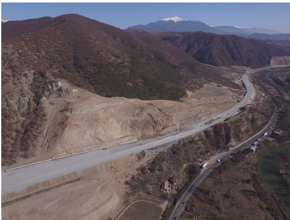
Снимка № 11. Свличане на земни маси в подучастък 3