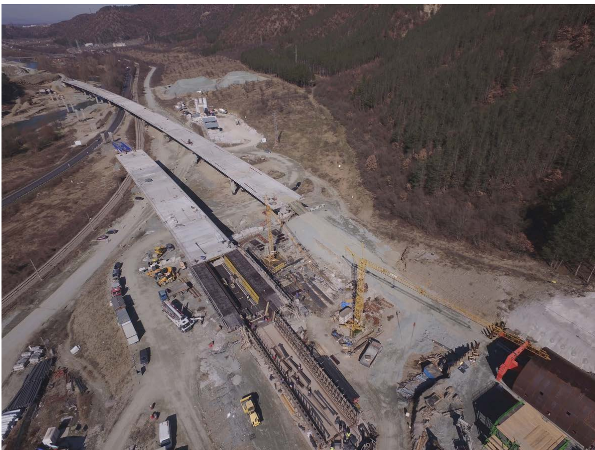
Снимка № 3. Напредък на строителните дейности по двете платна на моста в подучастък 1